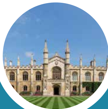
考伯思克里斯蒂学院